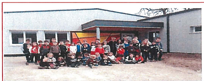
Bénédictio de nouveaux bâtiments à l'école Sacré Cœur de PLOUGONVER (20/05/2016)